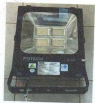
Hình 2: Mẫu thử

TRƯỞNG PHÒNG THỬ NGHIỆM ĐIỆN, ĐIỆN TỬ VÀ HIỆU SUẤT NĂNG LƯỢNG